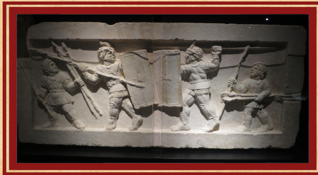
GRABRELIEF, AMITERNUM ABRUZZES, ITALIE, 1 ER S. AV.J.-C.

Deux des tout premiers types de gladiateurs étaient le gallus et le samnite. Tous deux sont mentionnés dans les sources textuelles de la République romaine, mais aucune représentation n'est connue. L'origine, l'équipement et les stades de développement font encore l'objet de discussions scientifiques et n'ont pas été clairement identifiés. Le relief de la tombe ci-dessous provient d'Amiternum et est considéré par certains historiens comme une représentation possible.